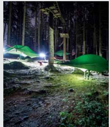
Erinnert Sie das auch an den Film «Avatar»?

Seit Anfang Juni bis im September 2017 ist der «Drachenberg Pilatus» um einen touristischen Naturplausch reicher: Auf der Fräkmüntegg – auf Hergiswiler Boden – kann man neu in einem schwebenden «Baumzelt» übernachten. Bis zu drei Personen können in einem sogenannten «Tree Tent» logieren, welches mit Spanngurten an drei Ankerpunkten an den umliegenden Bäumen befestigt wird. Es stehen insgesamt 15 Zelte zur Verfügung. Das «himmlische» Vergnügen kann an folgenden Daten gebucht werden: 4./5. und 18./19. August sowie am 9. September 2017. Gruppen ab zehn Personen übernachten auf Anfrage an jedem beliebigen, noch freien Datum. «Die neue Idee scheint Anklang zu finden», weiss Tobias Thut, Marketingleiter der Pilatus-Bahnen. «Es sind bereits einige Daten ausgebucht. Wer dieses Jahr noch eine Nacht auf Fräkmünt verbringen möchte, dem empfehle ich eine möglichst sofortige Reservation unter 041 329 11 11.»