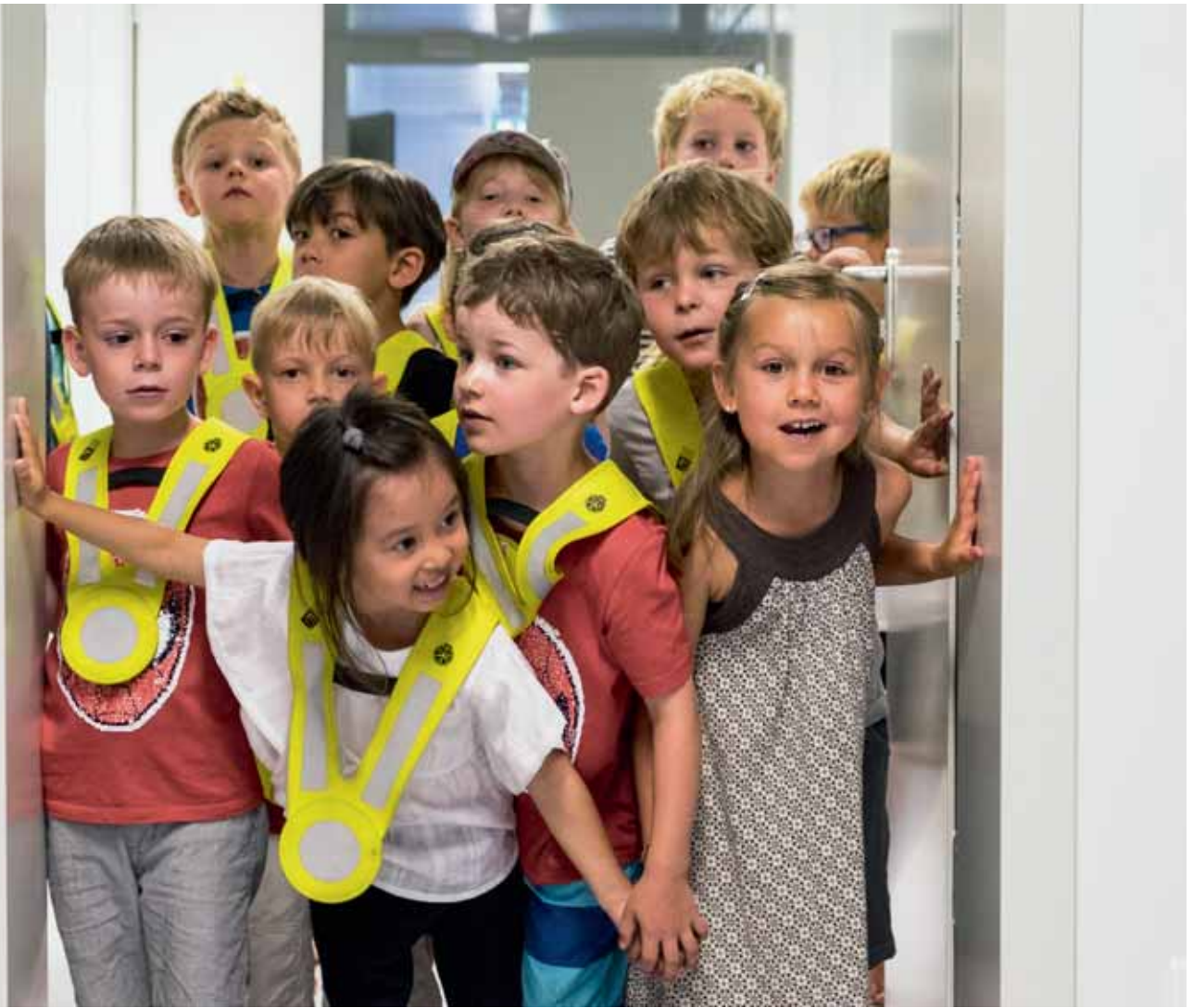
Die Kindergartenklasse aus der Grossmatt erspäht zum ersten Mal ihr neues Klassenzimmer im Provisorium.