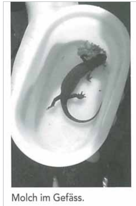
Molch im Gefäss.

Unten links und rechts: Interessante Bildausschnitte mit inhaltsarmen Bildlegenden zum Artikel über die Waldwoche des Schulhauses Dorf in der Schulbeilage. (Heft 2/07) S. 19, von oben nach unten: Die ersten Jahrgänge waren hochformatig, 2002 erfolgte der Wechsel zum Querformat. 2013 wurde ein neues Layoutkonzept umgesetzt. «Hergiswiler»-Titelbilder 1/84, 1/02 und 3/13.