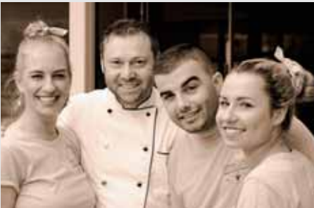
Dynamisches Quartett in «Tony's Steakhouse».