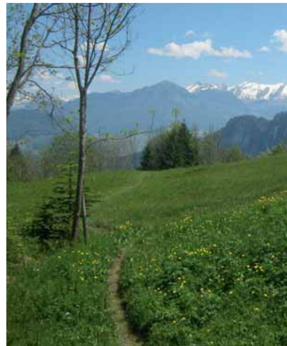
Links: Dem Steinibach entlang zum Krummstutz, oben das Krummstutzbrüggli. Rechts: Nach dem Krummstutz treten die Wanderer auf das Wiesland Hornäbelboden, wo sich eine imposante Aussicht auf die Alpen eröffnet (im Hintergrund der noch schneebedeckte Brisen).