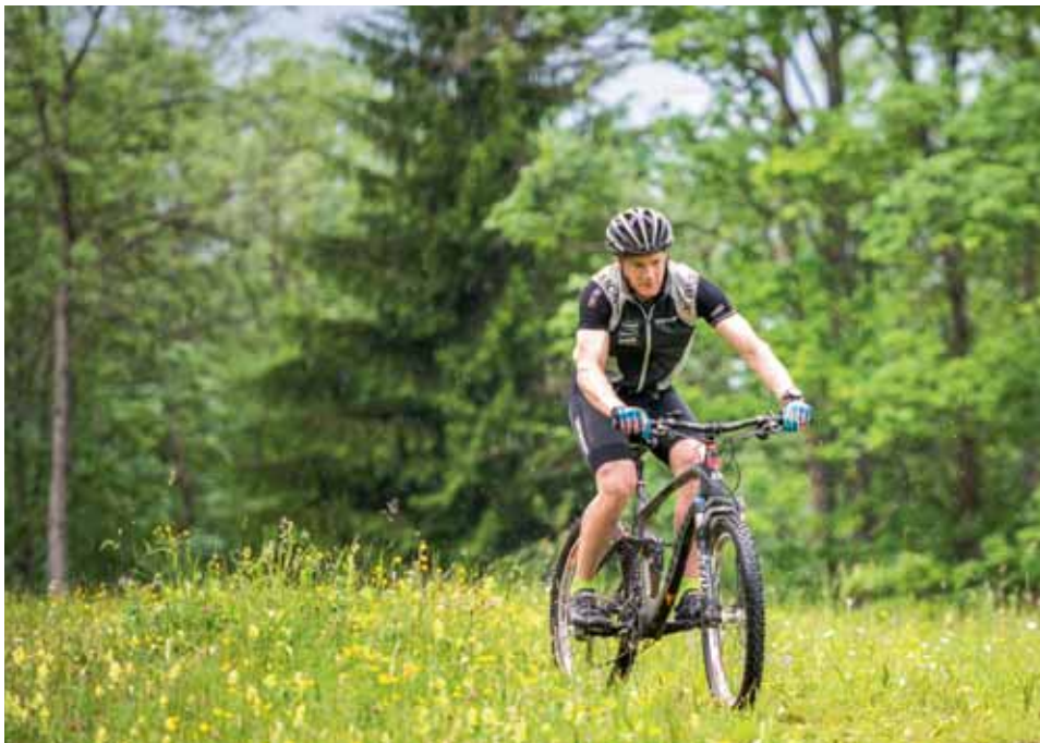
Das Sommertraining soll auch Spass machen: Mountainbiking bietet ein ideales Rundumtraining.