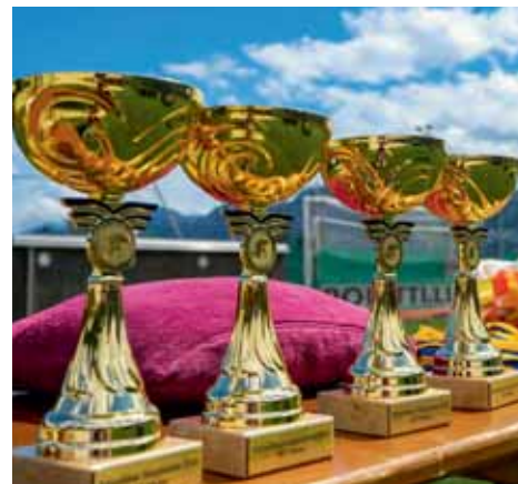
Glänzende Pokale für strahlende Sieger.