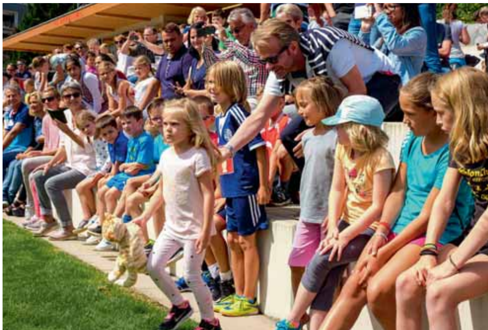
Auch am 20. August 2017 werden Fans, Papis und Maskottchen die Athletinnen unterstützen.