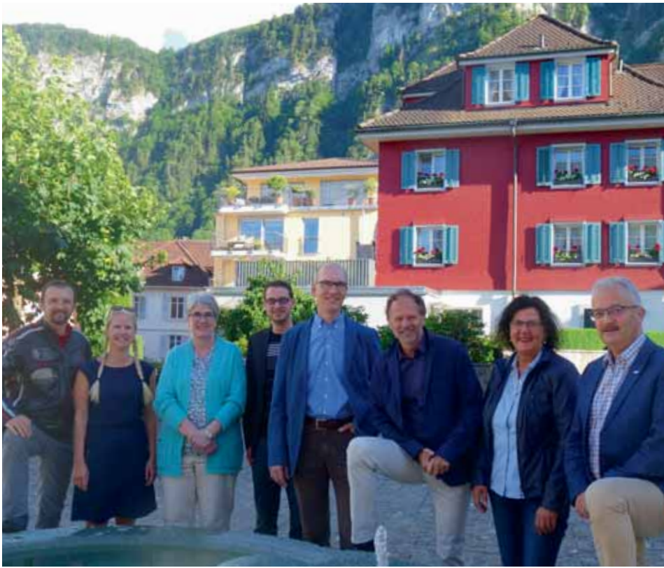
Die erfolgreiche Erarbeitung steht auch für den Wandel im ehemals turbulenten Kirchenleben in Hergiswil: Kirchenrat und Pfarreileitung demonstrieren Einigkeit.