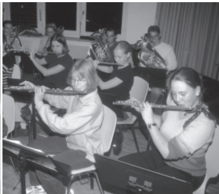
Harte Probenarbeit für die Wiedergeburt.