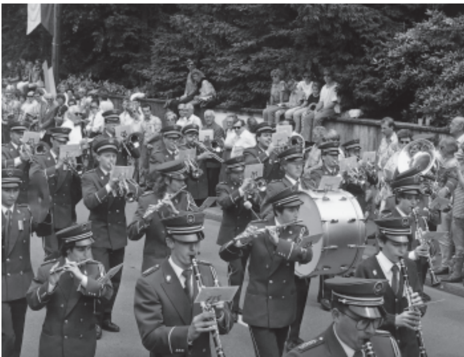
Viel Volk säumte die Seestrasse am letzten Musikfest 1992.

Zum Musikfest gehören aber nicht nur Wettspiele, sondern auch etwas fürs leichtere Gemüt. Dem initiativen OK unter der Leitung von Herbert Gnos ist es wiederum gelungen, ein attraktives Unterhaltungsprogramm für jeden Ge-schmack auf die Beine zu stellen.