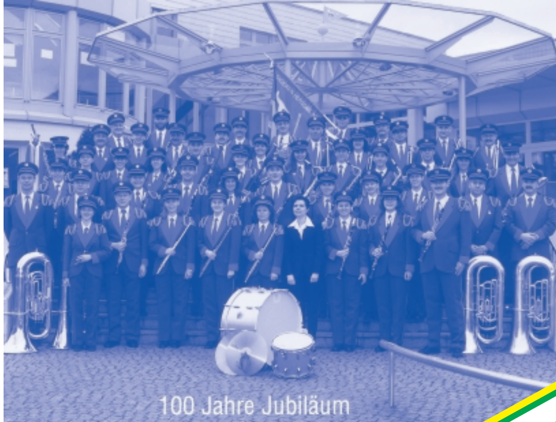
Musikverein Hergiswil 1900–2000

Kein Ballermann, sondern Hotelkönig Seite 3 Die Gnome sind erwachsen Seiten 4/5 Leitbilder: Der Weg in die Zukunft Seiten 6/7/15/17 Musikfest zum 100-Jahre-Jubiläum Seiten 10/11 Von der CCY zur Jugendmusik Seite 12