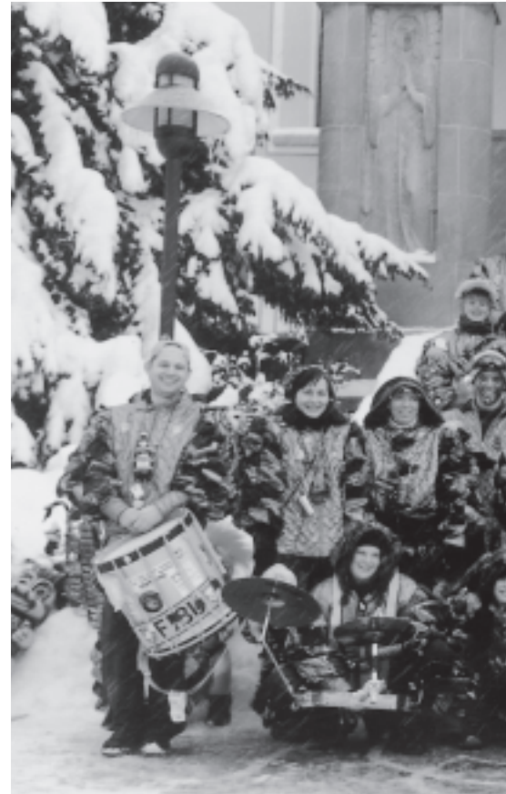
Seit 35 Jahren prägen die Loppergnomen das fasnä