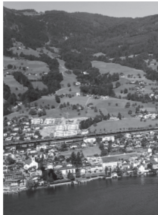
Hergiswil – eine Gemeinde geht mit Zuversicht in die

Die Entwicklung eines Leitbildes ist für die Exekutive keine einmalige Aufgabe. Im Gegenteil. Es handelt sich um einen Prozess, der über einen Zeitraum von fünf bis zehn Jahren angelegt wird. Und er muss laufend überprüft werden. Erfahrungen mit diesem Führungsinstrument konnten in Hergiswil – wie erwähnt – bereits gemacht werden. So wurde das 1990 entwickelte Leitbild in den ver-