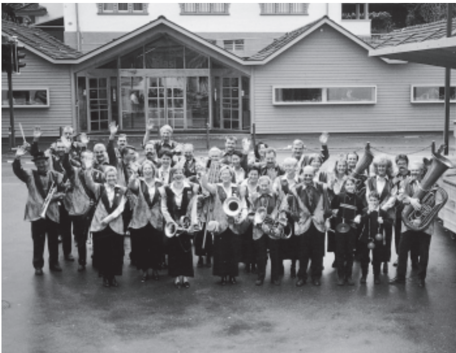
Im Saft wie zu früheren Zeiten: Die AltGNOME.

Erfolgsgeschichte stösst man immer wieder auf Namen, die auch für Nichtfasnachtler ein Begriff sind. Da gibt es unvergessliche Pioniere, Chrapfer, Majore, OK-Präsidenten, Idealisten und viele mehr. Herausragende Pfeiler aus der neuesten Vereinsgeschichte sind