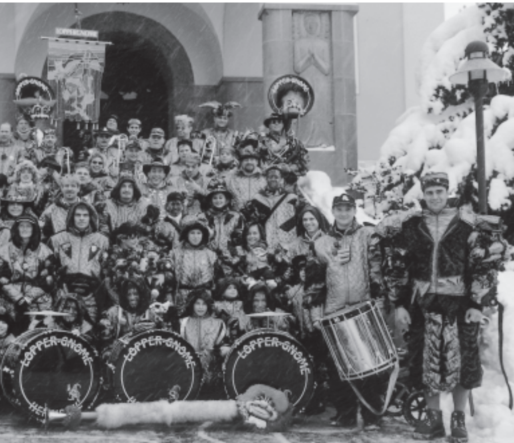
Lebendige Dorfleben in Hergiswil und der Innerschweiz.