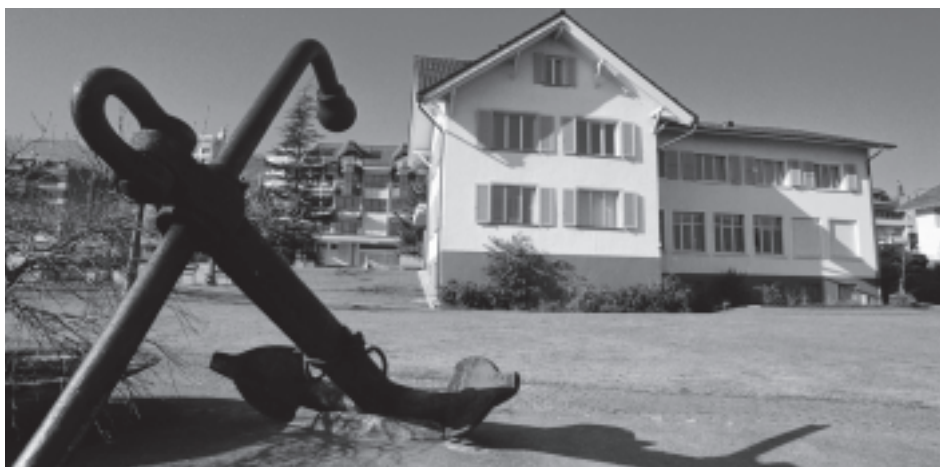
Unser Gemeindehaus direkt am See – transparent und kundenfreundlich.

Keine juristische Verbindlichkeit – vielmehr moralische Verpflichtung Damit Leitbilder nicht zu Papiertigern