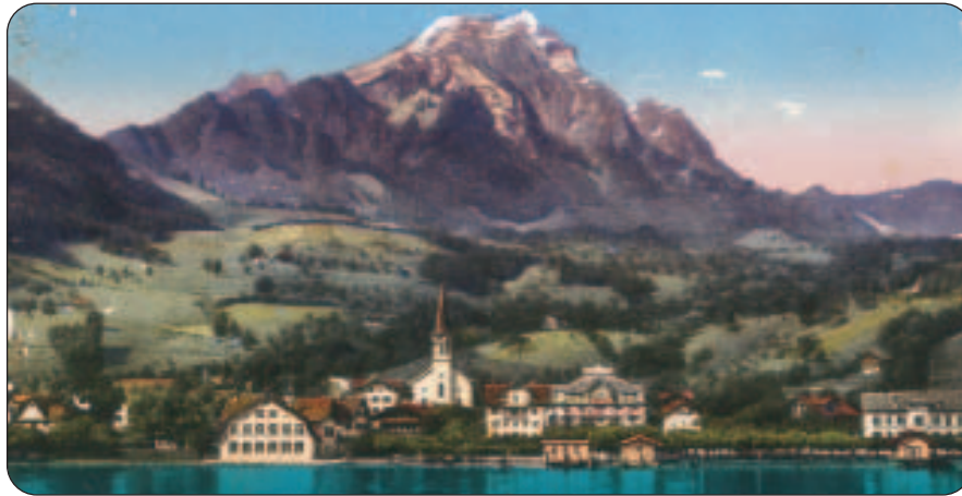
Zum Bellevue-Rössli gehörten die drei Häuser rechts der Kirche.

Eine Wirtschaft Rössli, erstmals im Jahr 1785 in einem Kaufbrief erwähnt, stand im Mattenboden. Das Haus steht noch heute am Baumgartenweg 3, wird Alt-Rössli genannt. Das spätere Rössli entstand 1852 beim heutigen Rössliplatz. Um diese Zeit blühte in Hergiswil der Fremdenverkehr. Unter anderem stieg am 27. Juni 1884 Fürstin Dolgaruki, Witwe des russischen Zaren Alexander II mit Prinz und zwei Prinzessinnen im Rössli ab. Von hier aus erkundeten die Herrschaften den Pilatus. Direkt neben dem Hotel Rössli gab es einen Stall, der bis zu 100 Pferden Unterkunft bot. An schönen Sommer- und Herbsttagen waren jeweils 20 bis 30 Pferde unterwegs, welche Touris-