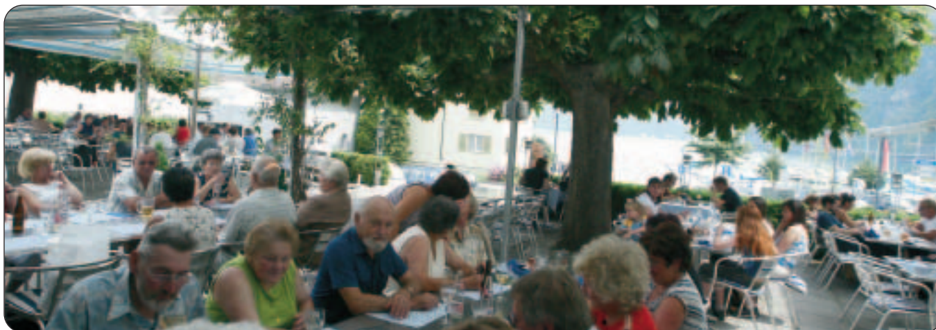
Glasi-Restaurant Adler: Aussicht von der Terrasse auf See und Berge.