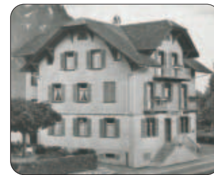
1962 abgebrochen – das Rütli.