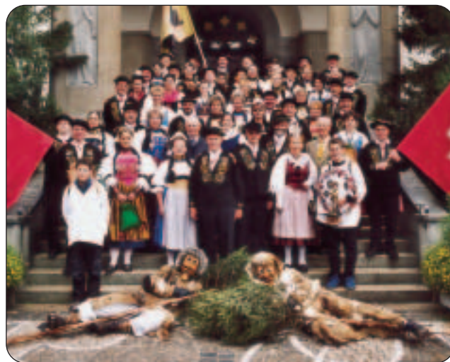
Auf der Kirchentreppe: Die Älplergesellschaft 2002–2004.

Goldschmiedeatelier Simon Style Seestrasse 45 Tel. 041 630 29 14 Montag geschlossen