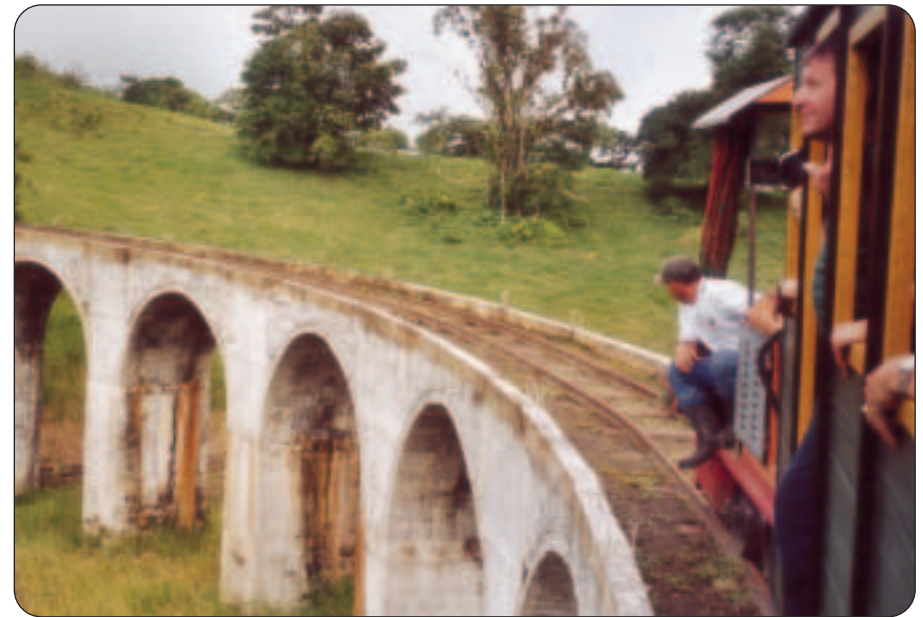
Langsam schnauft die Lok bergaufwärts. Hier über das bündnerische Viadukt. Alle Bauten auf dem Anwesen wurden mit Hilfe von Einheimischen erstellt.