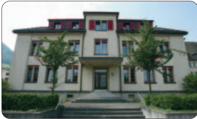
altes Schulhaus Dorf