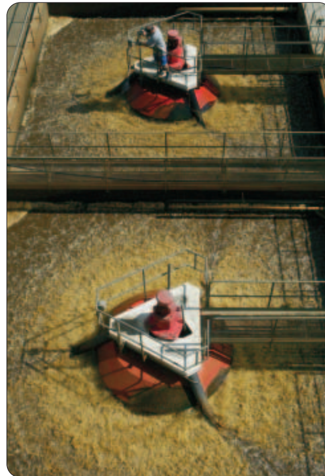
Das Kernstück der ARA: Die biologische Reinigungsstufe.

reglement abzustimmen. Der Gemeinderat hat dem entsprochen. Die Urnenabstimmung wird am 28. November 2004 stattfinden.