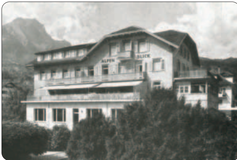
Alpenblick: Geburtsort vieler Hergiswiler.

baulich heruntergekommen war, sowie auch das kleine Haus «Schöntal» an der Seestrasse, wurden abgebrochen. Das Gebäude der ehemaligen Pflegerinnenschule wurde zum heutigen Gemeindehaus umgebaut. Aus den ehemaligen Gemüsegärten um das einstige Kinderheim und entlang der Seepromenade entstand eine öffentliche Parkanlage mit Kinderspielplatz.