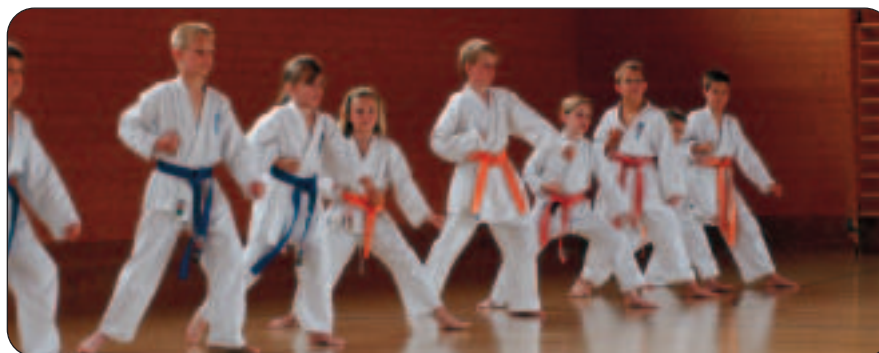
Die jüngsten Yamabushi in Aktion.

Im November fahren einige «Pilatuskrieger» sogar nach Spanien, um dort ein Intensivseminar zu besuchen. Denn die Karate-Philosophie kann nur wachsen durch stetes Training.