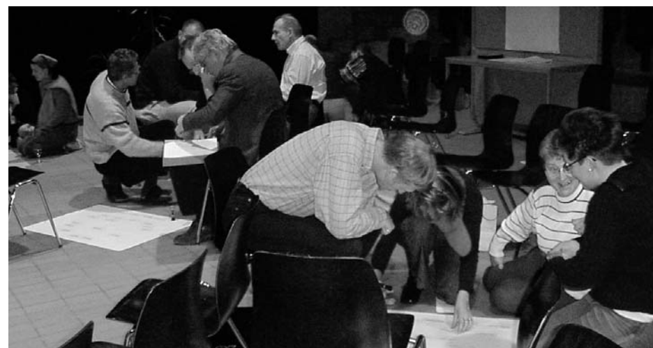
Arbeit in unterschiedlichen Teams gehört zum Lehreraltag.

Diese Qualitätsstandards werden in den Stufen und Lehrerteams im laufenden Jahr besprochen. Das Thema wird uns auch im folgenden Jahr beschäftigen. Eine Evaluationsgruppe wird die Arbeit überprüfen und der Schule Rückmeldungen über das Erreichen dieser Ziele geben.