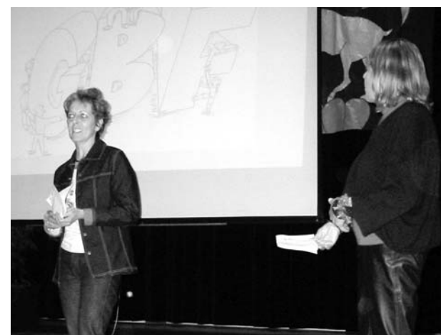
Beurteilen ist auch in der Grundstufe ein wichtiges Thema.