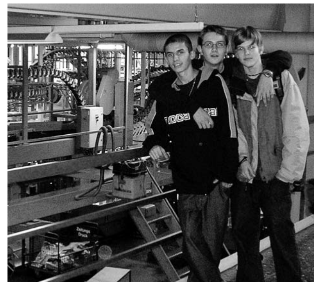
Ist das der neue Arbeitsplatz?