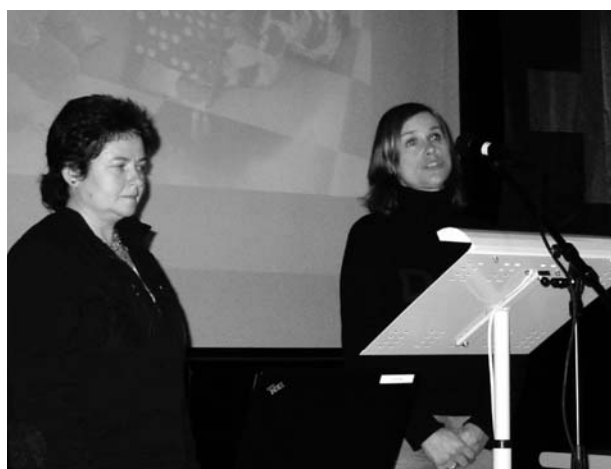
Das Lehrerteam stellt sich vor.