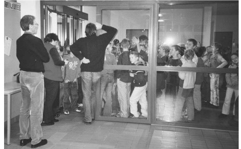
Lesenacht in der Grossmatt.

Im Anschluss gingen alle Klassen in ihre Schulhäuser und dort durfte man lesen oder schlafen. Wer in den Morgenstunden noch lesen wollte, musste sich ruhig verhalten und in den Schlafsack verkriechen. Mit der Taschenlampe war es dann möglich, weiter zu lesen. Still wurde es ca. um drei Uhr, da zu diesem Zeitpunkt auch die letzten