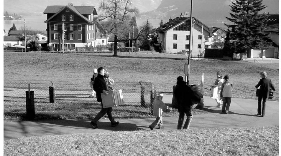
Alles Brauchbare wird in einem fröhlichen Umzug gezügelt.