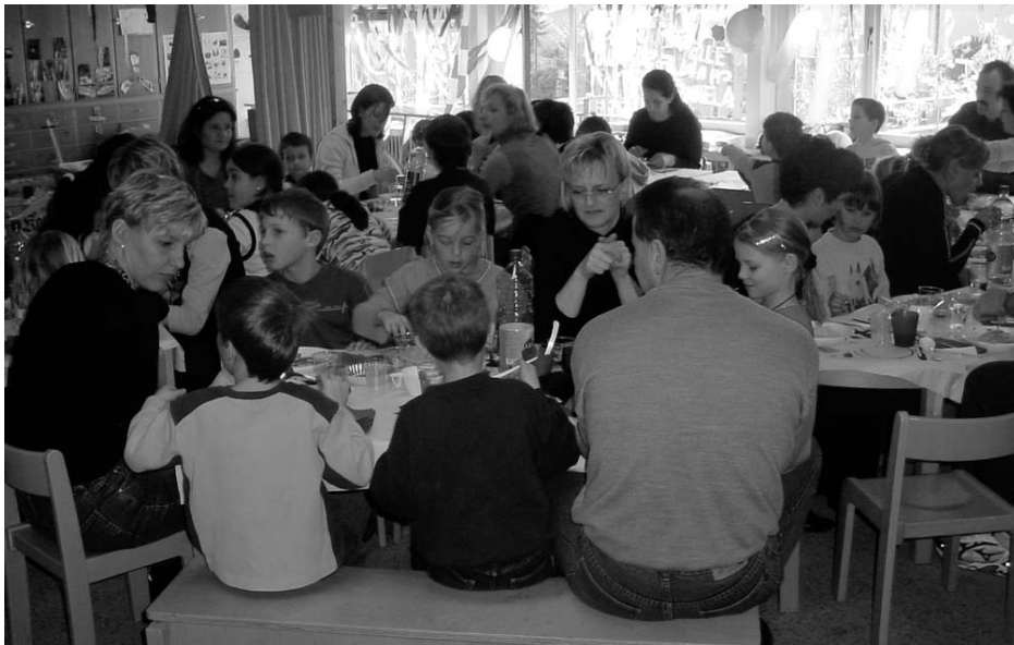
Letztes Mittagessen in den alten Räumen.