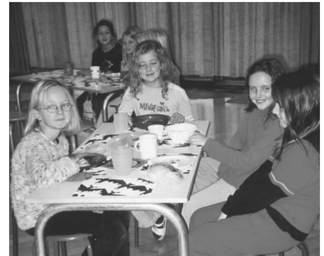
Am Morgen gab es kleine Äuglein.