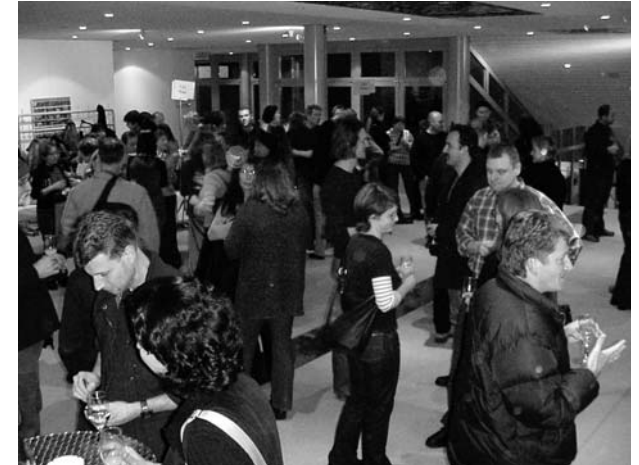
An den Stehtischen waren jeweils einzelne Schulstufen vertreten.

tung bei Lehrerschaft und Schulrat nach dieser Veranstaltung zeigte, dass dieser Anlass als eine sinnvolle Ergänzung zu den «klassischen Elternkontakten» angesehen wird. Es wird ihn auch im nächsten Schuljahr wieder geben. Vielleicht zu einer anderen Jahreszeit, finden doch im Januar jeweils schon die Elterngespräche rund um die Zeugnisse statt.