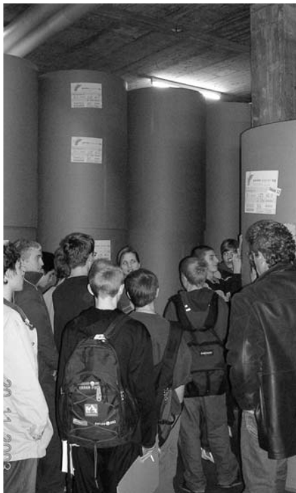
Unglaublich, wie gross diese Papierrollen sind.

men und wie die Sportfotos bis auf das kleinste Detail bearbeitet werden. Uns wurde noch gesagt, dass ein Bild in der Zeitung pro Quadratmillimeter 2.90 Franken kostet. Als der Sportredaktor fertig war, irrten wir nach draussen und stiegen in den Bus, der uns in die Druckerei nach Adligenswil brachte. Nach