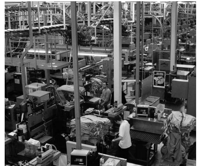
Wer findet sich in diesem Dschungel zurecht?