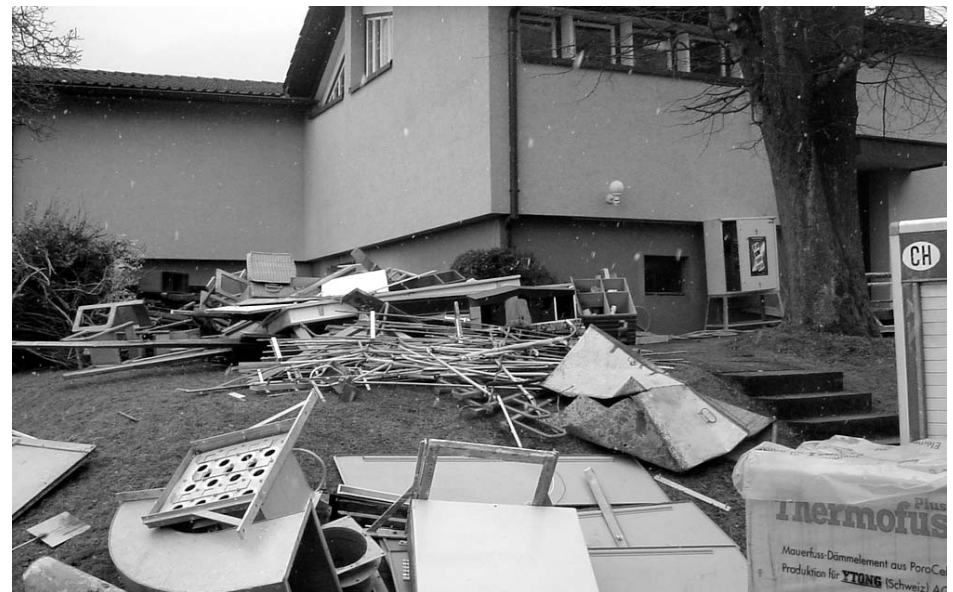
Und schon am nächsten Tag ging der Umbau los.