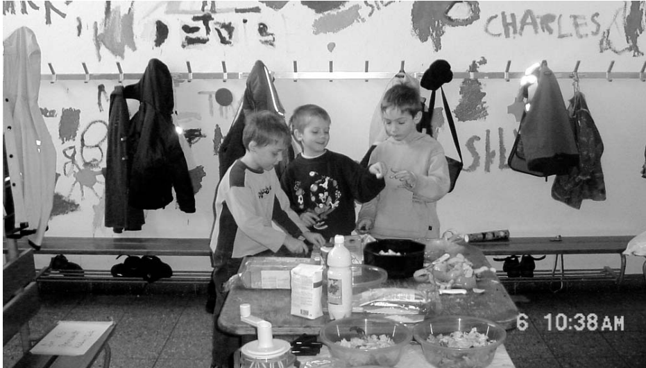
Für die Eltern wurde von den Kindern mit viel Freude ein Mittagessen gekocht.