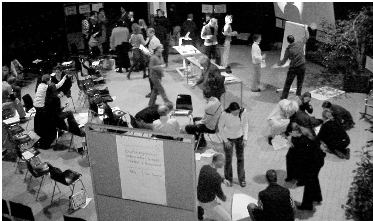
Die Aula verwandelte sich in eine grosse «Lernwerkstatt».