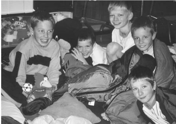
An Schlaf war lange nicht zu denken.

Die Mittelstufe der Schulhäuser Dorf und Matt führten gemeinsam ein für uns Schüler aufregendes und spannendes Erlebnis durch. Eine Lese- und Filmnacht mit Übernachtung im Schulzimmer.