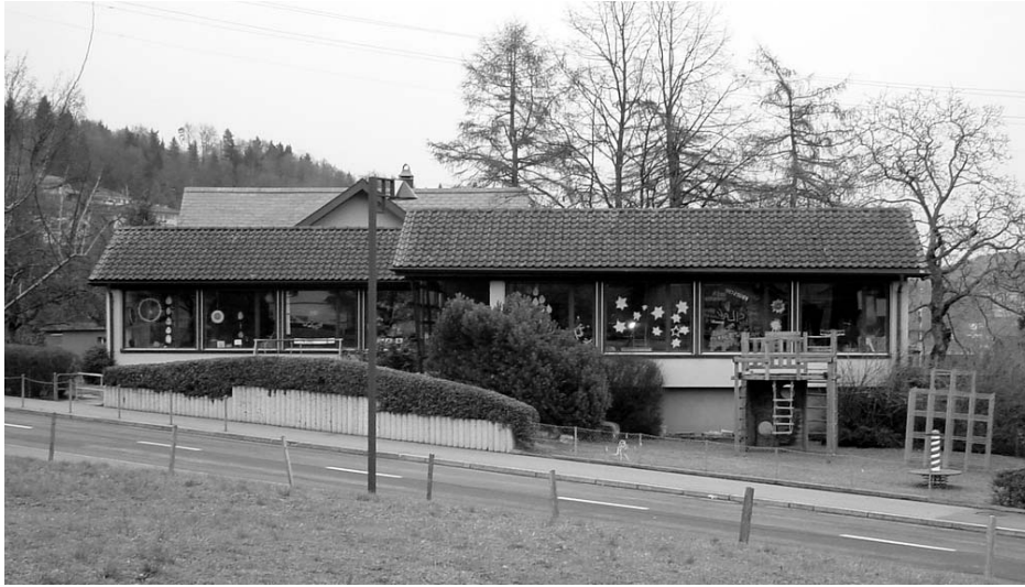
Der Eingang wird beim Umbau weg von der Strasse Richtung Matt verlegt.