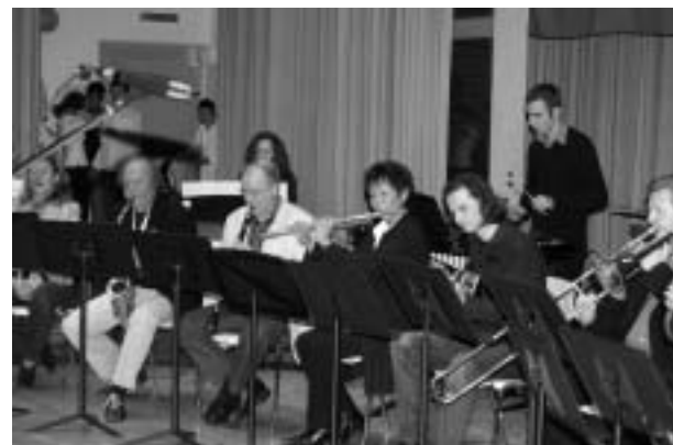
Hergiswiler Musiklehrer beim Fest zum Jubiläum 25 Jahre MS.

mieren. Nebst unseren Fachlehrpersonen werden auch Ensembles in verschiedenen Besetzungen aufspielen und zeigen was für Möglichkeiten es gibt, miteinander zu musizieren. Zwei Musikfachgeschäfte werden anwesend sein, um Fragen betreffend Instrumentanschaffung, Mieten von Instrumenten und anderes mehr fachlich beantworten zu können. Der Besuch dieses Anlasses ist nicht nur auf die 2.- Klässler beschränkt, sondern für alle Primarschüler. Es ist nie zu spät mit dem Erlernen eines Instrumentes anzufangen.