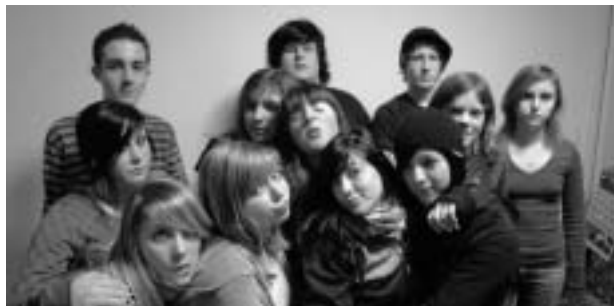
Die frechen Schüler in Action.

Schauspieler, Sänger, Techniker, Band, Bühnenbau: 50 Schülerinnen und Schüler der ORS Hergiswil und ehemalige von Bigmatt, Schülerchöre der 2. und 3. ORS.