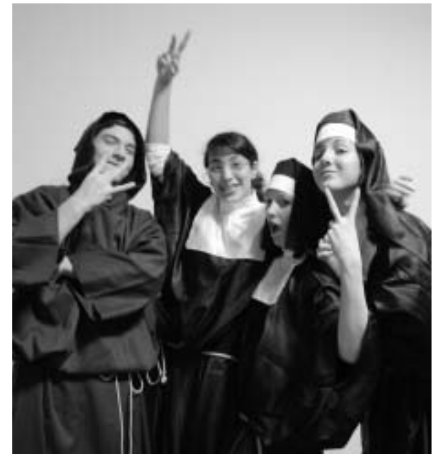
Sister Mary Clarence und drei ihrer Nonnen oder Brüderkollegen.