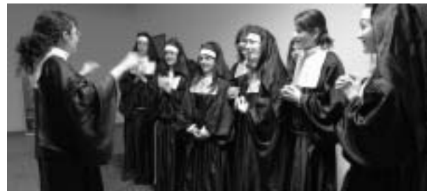
Sister Mary Clarence bringt den Nonnenchor wieder zum Singen.