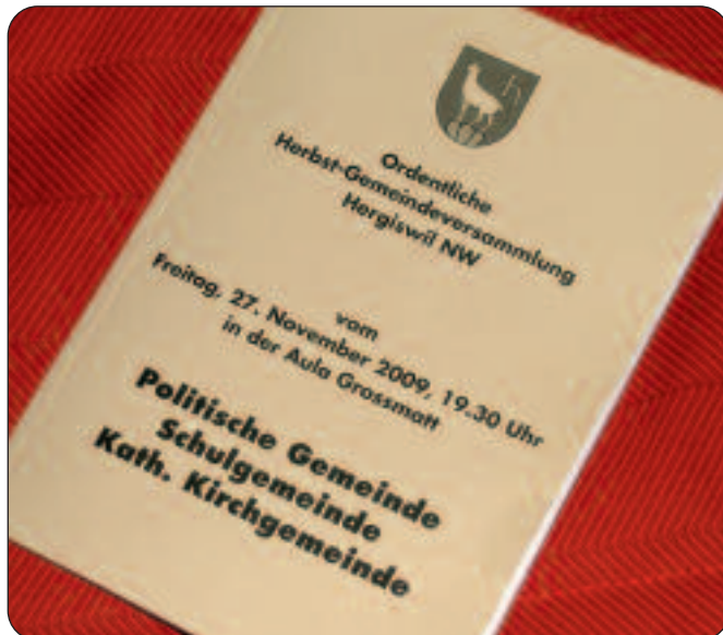
Neues Büchlein: dünner, klarer, verständlicher.