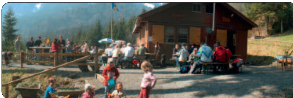
Im Sommer als Grillplatz, im Winter neben der Schlittelpiste liegend als Zwischenhalt geschätzt: die Bockrüti-Hütte.