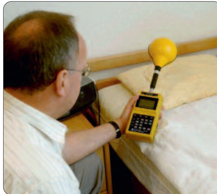
Elektrosmog schädigt die Gesundheit: Ein Experte für biologische Elektrotechnik misst die Belastung im Schlafzimmer.

unabhängig davon, ob Strom fliesst oder nicht. Wenn dieser fliesst, zum Beispiel bei einer brennenden Lampe, entsteht zusätzlich ein magnetisches Feld. Gemeinsam mit Funk-,