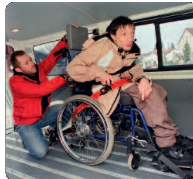
Das Luzerner Rollstuhltaxi fährt jährlich rund 600 Mal in den Kanton Nidwalden.

LU tixi, Rollstuhl Taxi Genossenschaft, Eichwaldstr. 9, 6005 Luzern, Telefon 041 240 37 10 www.lu-tixi.ch Postkonto: 60-6522-6, Vermerk «30 Jahre»