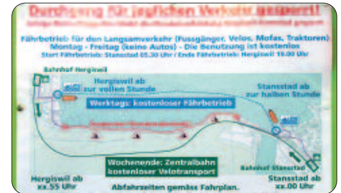
Signalisation bei der Fähre.

In Phase zwei wird die Bevölkerung weiterhin sowohl auf der sachlichen Ebene (Situation und Auswirkungen) informiert, als auch auf der emotionalen Ebene. Die Bevölkerung soll erfahren: Die Verantwortlichen setzen sich ein und tun alles erdenklich Notwendige. Aber das braucht Zeit. «Bitte habt Verständnis, dass nicht alles von heute auf morgen