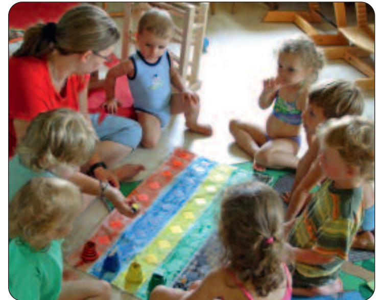
Ab Sommer 2010 auch in Hergiswil: eine Tageskrippe für Kinder von drei Monaten bis zum Eintritt in die Grundstufe.

Das Chinderhuis Nidwalden geniesst bei Familien und Behörden grosses Vertrauen – dank seinen 17 Jahren Erfahrung im Bereich der familienergänzenden