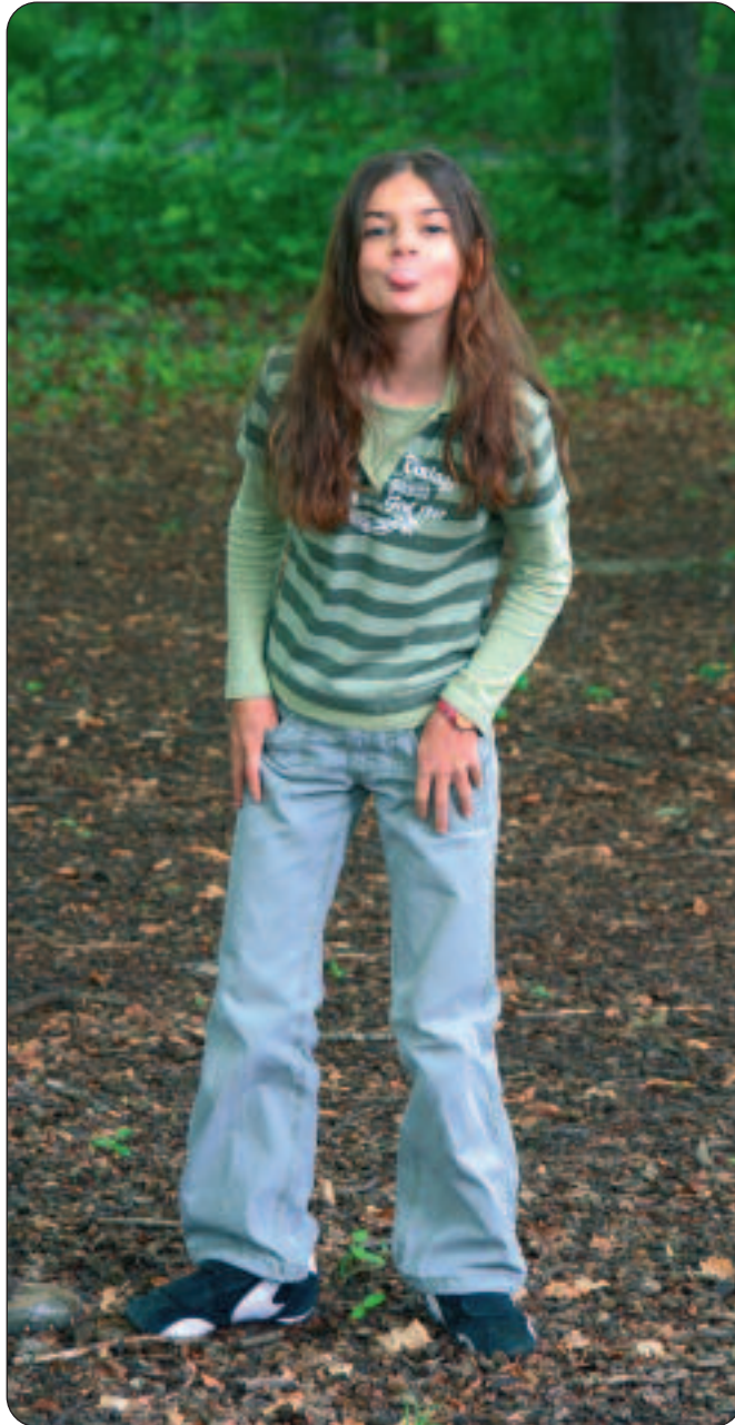
ADHS-Kinder sind besonders impulsiv.