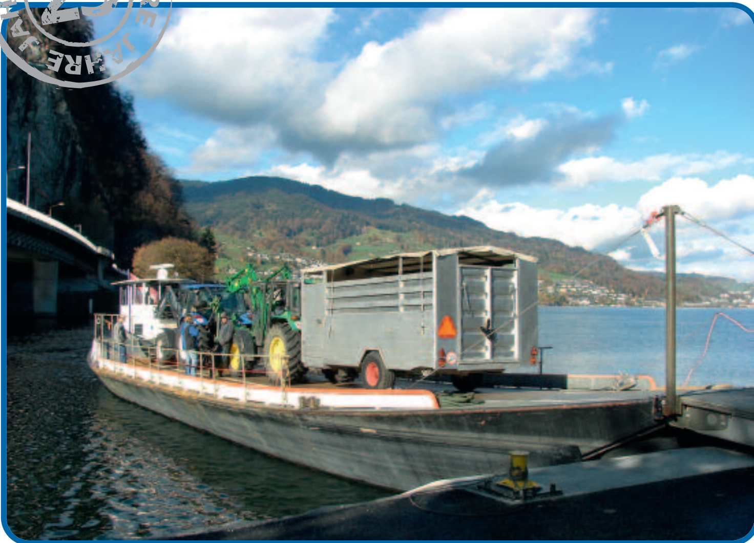
Bedrohlicher Lopper – gesperrte Strasse: Nauenverlad in Stansstad mit Blick auf Hergiswil.